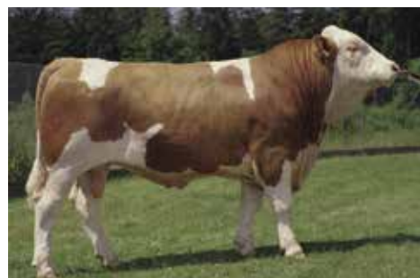
BFG Pajero PS