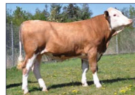
BFG Vulpi PP