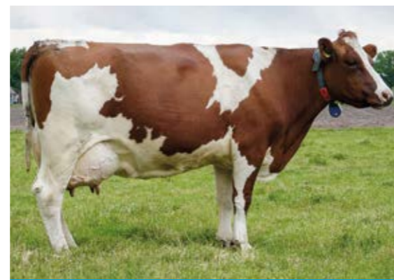
Ida 54: in de 4 e lactatie weer met 1 inseminatie drachtig.

“Mombasa is een dubbeldoelstier en hij vererft +0.89% vet en +0.34% eiwit. Waarom zou je dan nog Jersey gebruiken?”