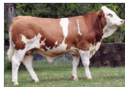
BFG Hex Hex Pp